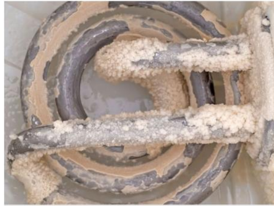
Fenómeno de obstrucción de la balanza de calefacción en el campo de la vida